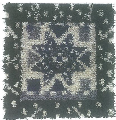
B-785 • A S K

I følge den norrøne skapelsesberetningen, Voluspå, var Vilje en av de tre første æsene. Vilje, Ve og Odin var brødre, og sammen skapte de verden. Da de skapte menneskene gav Odin dem ånd, av Ve fikk de varme og farge, og av Vilje forstand.