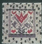
V I L J E