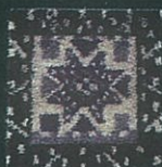
A S K