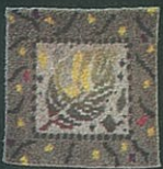
B A L D E R