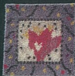
E M B L A